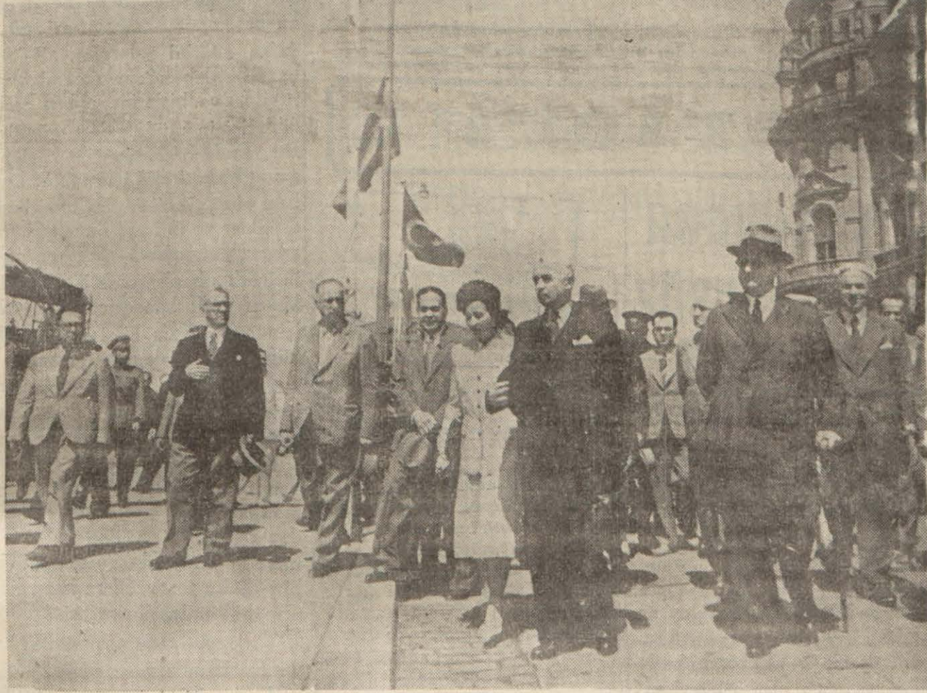
Millî Şef Haydarpaşa garından çıkarılırken

İstasyonda coşkun tezahüratla karşılanan Cümhurreisimiz doğruca Floryaya gittiler