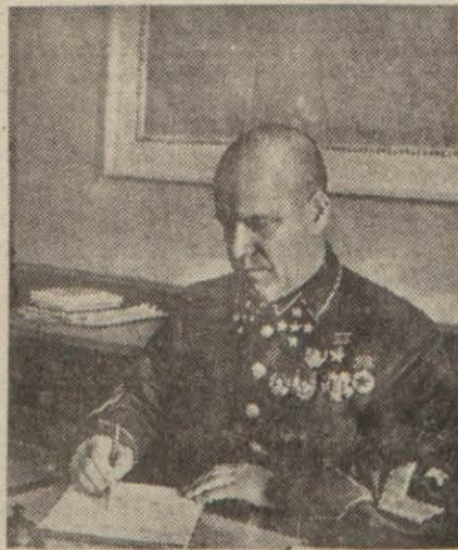
Merkezdeki Sovyet ordusu baş komutanı General Zukof

Leningrad önünde mevzî savaş faaliyeti vardır. Müsademe kuvvetlerinin yaptığı bir hareket esnasında